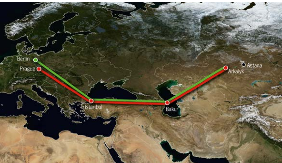
Mapa znázorňující trasy obou letounů CASA z Prahy a Berlína do Arkalyku včetně dvou mezipřistání.

První transport koní Převalského z Evropy do Altyn Dala proběhne 3. až 4. června 2024. Počítá se s přepravou tří hřebců a pěti klisen z Prahy a Berlína dvěma letouny CASA C-295M Armády České republiky. Čtyři koně vypraví Zoo Praha jedním strojem z vojenského letiště Praha-Kbely, další čtyři vypraví z Berlína Tierpark Berlin.